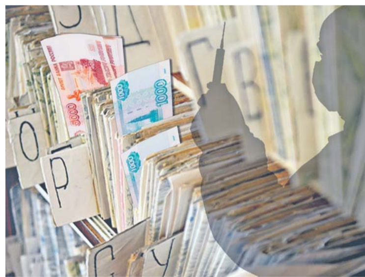
Коллаж Евгения КАРТАШОВА

...Многие болячки, из-за которых пациенты обращаются в клиники, можно вылечить после одной-двух консультаций, опираясь на основные общие анализы. Этого достаточно для определения картины и назначения адекватной схемы лечения. Но так лечить со-