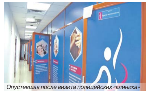
Опустевшая после визита полицейских «клиника»

Тот самый автомеханик позже рассказал полицейским: в организации он работал месяц. На работу устроился после того, как его пригласили по телефону. Прошёл обучение, которое продолжалось четыре дня. Новичкам сообщили: они попали под крыло солидной компании, у которой сорок филиалов в разных городах и странах. Лапшу на уши вешали так щедро, что новые сотрудники принимали эти слова за чистую монету. Правила выполнения медицинских процедур он изучал по