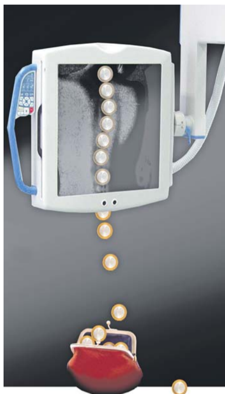
Коллаж Евгения КАРТАШОВА